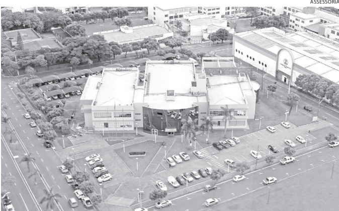
Concurso foi revogado por razões legais e fiscais