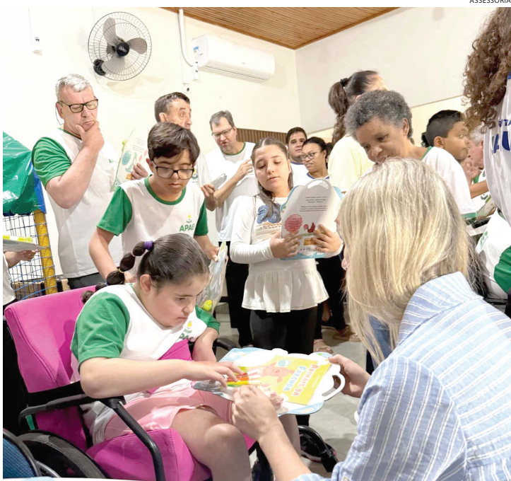
Ação reuniu secretaria, direção, professores e servidores

Cerca de 900 kits de pintura foram entregues aos alunos da Rede Municipal de Educação