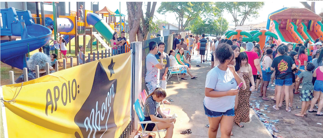
Equipes da Prefeitura atuaram de forma conjunta na organização