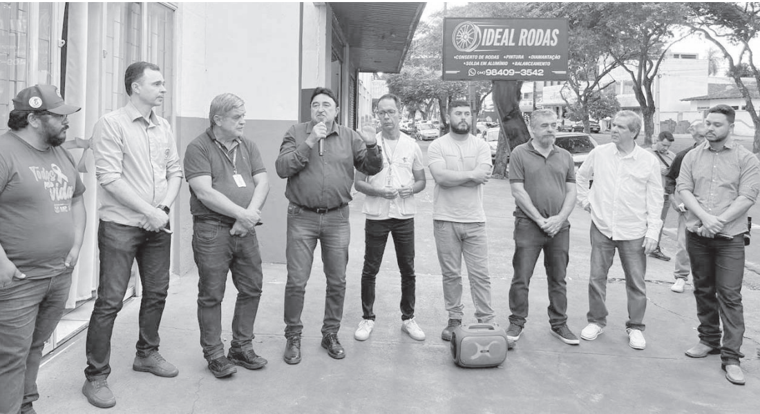
Desde sua criação, a Cooanorte tem se tornado referência regional

Nova estrutura, localizada na Avenida Amazonas, 968, é resultado do avanço da agricultura familiar