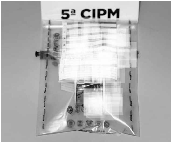
Material apreendido foi encaminhado à 21ª Subdivisão Policial (SDP)

De acordo com a corporação, os agentes avistaram um grupo em frente a um bar. Ao perceber a aproximação da viatura,