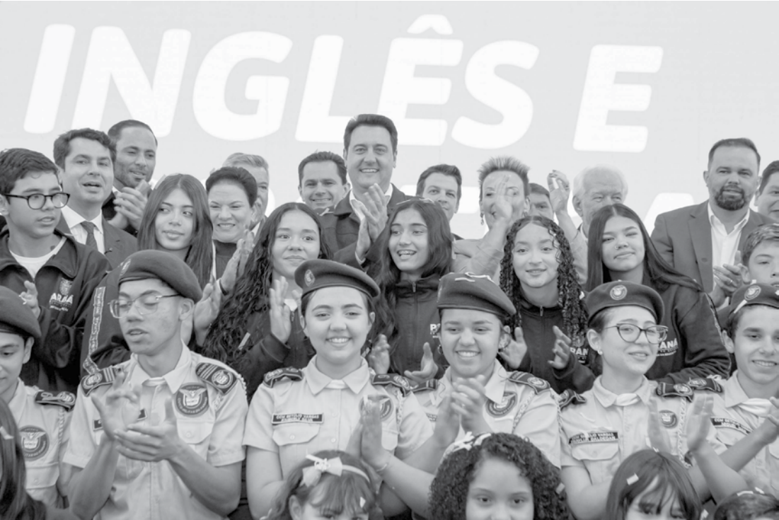
Governo moderniza escolas e leva robótica e inglês à rede municipal

Governo do Paraná moderniza escolas e leva robótica e inglês à rede municipal