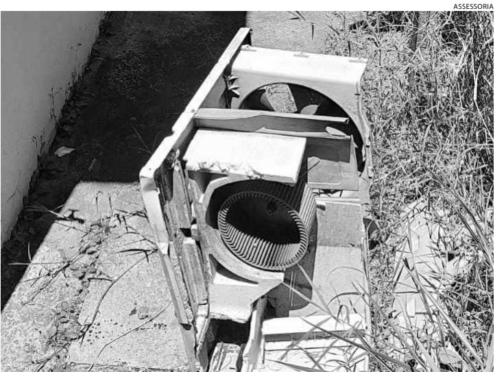
No local, havia sinais de arrombamento