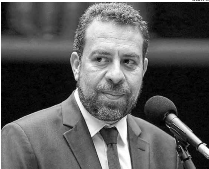
Boulos tem 43 anos e uma trajetória política voltada ao ativismo urbano

Novo ministro usa redes sociais para agradecer confiança de Lula