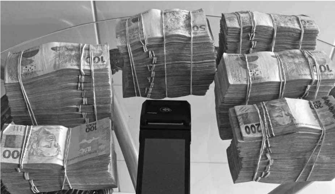
Mais de 350 policiais, incluindo de Cianorte, participaram da operação

Ações ocorreram simultaneamente no PR, Mato Grosso do Sul, Santa Catarina e São Paulo