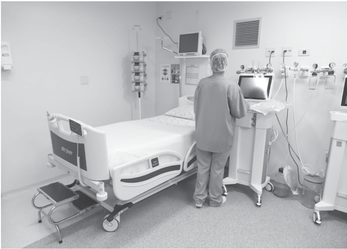
Benefício é válido até o final de abril de 2026

Dois importantes benefícios fiscais para a saúde pública paranaense já estão em vigor. A isenção do Imposto Sobre a Circulação de Mercadorias e Serviços (ICMS) sobre a energia elétrica de hospitais públicos e beneficentes que atendem pelo Sistema Único de Saúde (SUS) e sobre o succinato de metoprolol vai beneficiar milhões de cidadãos em todo o Estado, seja na forma de medicamentos mais baratos ou de uma redução nos custos de manutenção de hospitais. Os decretos 11.401 e 11.402 foram homologados nesta segunda-feira, 20, pela Assembleia Legislativa do Paraná, cancelando os textos enviados pelo Governo do Estado no início do mês. Com a aprovação no Legislativo, as duas medidas ganham caráter de lei. No caso da medida voltada à isenção do ICMS sobre a energia elétrica de hospitais que atendem pelo SUS, o benefício é válido até o final de abril de 2026 e vai permitir que os hospitais que se enquadram nos critérios possam solicitar o imposto zero junto às empresas fornecedoras de energia.