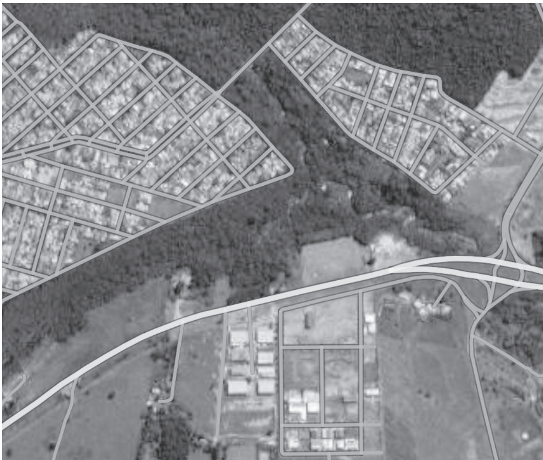
Grande parte dos loteamentos investigados surgiu após 2020

Loteamentos não seguem padrões legais e geralmente são abertos sem rede de esgoto, água potável, iluminação pública ou drenagem de águas pluviais