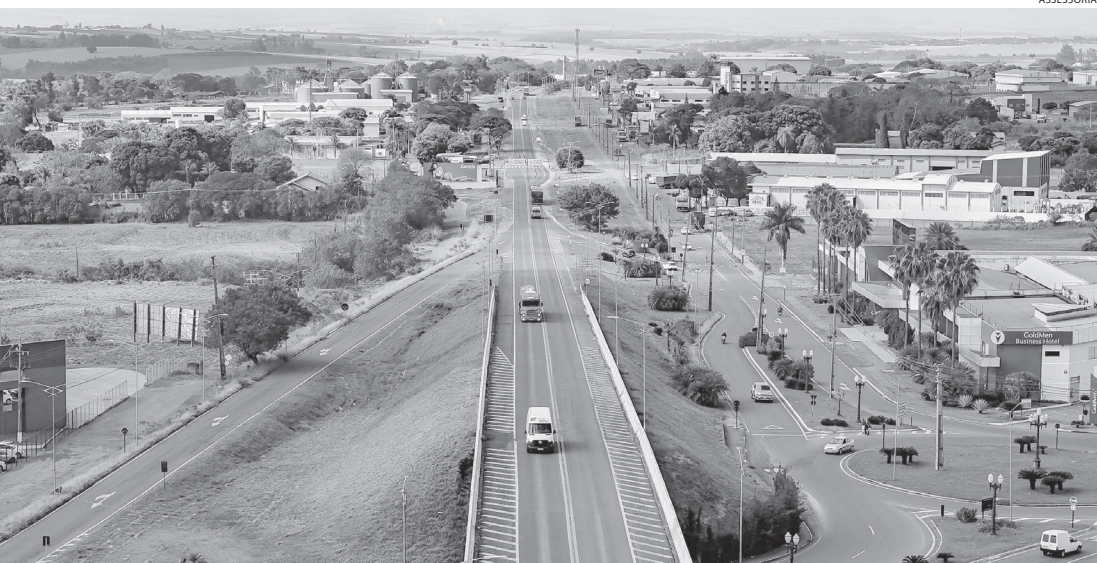
No trecho que corta Cianorte, estão planejadas obras de grande porte

Concessão inclui a PR-323, que liga Maringá a Iporã, passando por cidades importantes do Noroeste do Estado